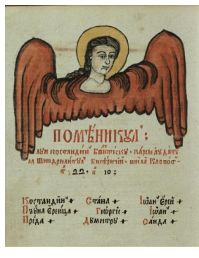
Imagine 1-Miniatură, heruvim, Pomelnicul mănăstirii Costești, Vâlcea, 1834-1886, < http://byzantion.itc.ro/web/Imagine//818.jpg-818 >, 10 septembrie 2019.

Trecând peste aparenta dificultate legată de caracterul imaterial și incomprehensibil al puterilor îngerești, iconarii au apelat la numeroasele angelofanii consemnate în Sfânta Scriptură sau în Viețile sfinților, mai exact, la acele forme simbolice, antropomorfe sau teriomorfe, care au fost asumate de către îngeri, circumstanțial, pentru a intra în contact cu anumiți oameni. Dificultatea de a percepe și recunoaște îngerii este semnalată în Sfânta Scriptură prin numărul de chipuri sub care ei apar ca și prin impresia pe care ei o lasă. Ei apar ca ființe cu multe înfățișări, care inspiră teamă, care copleșesc prin prezența lor (Zaharia, tatăl Sfântului Ioan Botezătorul „s-a tulburat și frică a căzut peste el”-Lc. 1, 12), apar sub formă de nor și de foc (Ieș. 13, 21-22; 23, 20-23), sau glasuri fără chip (Fac. 21, 17), sau, în viziunile lui Iezechiel (Iez. cap. 1 și cap. 10) și Isaia (Is. cap. 6), ca ființe complexe, greu de descris. 2