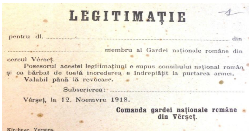
Legitimație de membru al Gărzii Naționale Române din Vârșeț